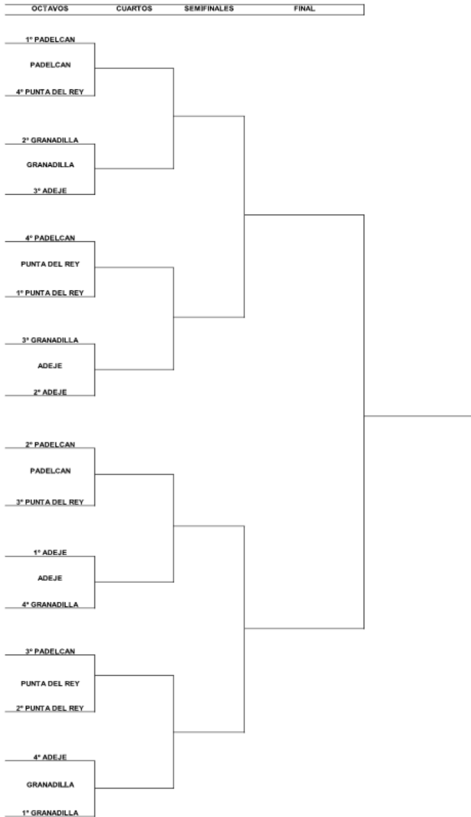
Ejemplo Cuadro Octavos de final, PLAYOFFS, de la Liga GAPP